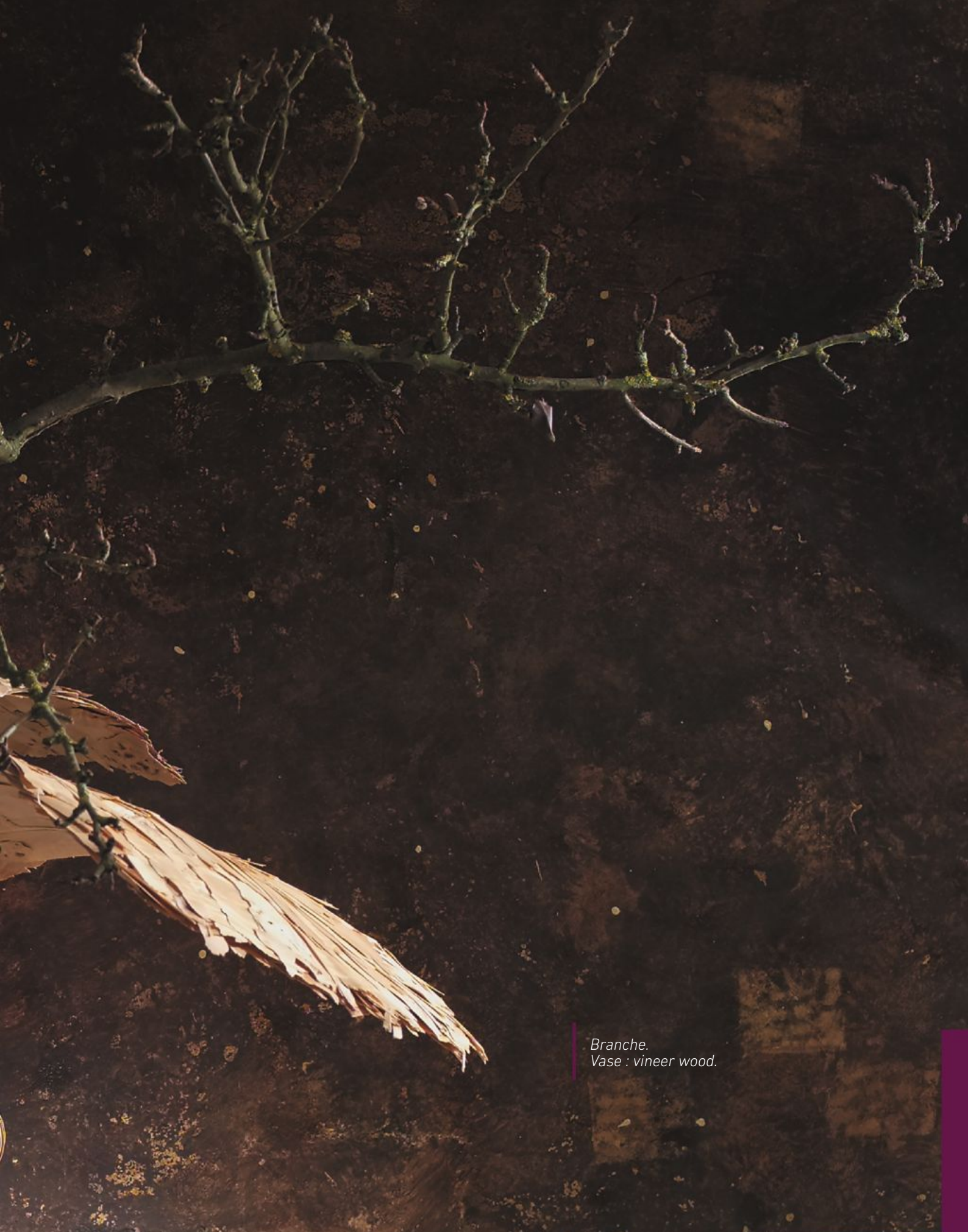
Branche. Vase : vineer wood.