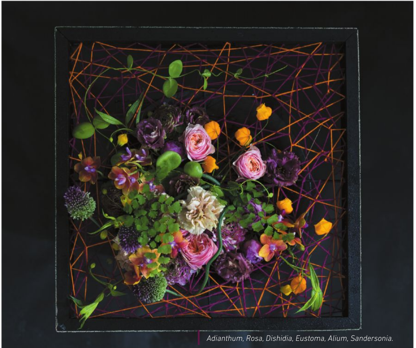
Adiantum, Rosa, Dishidia, Eustoma, Alium, Sandersonia.